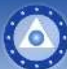
TSEYOR Centro de Estudios Socioculturales Barcelona (España) Asociación núm. 28475 NIF G62981112